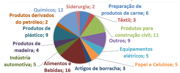
FIGURA 1 – Setores das empresas outorgantes